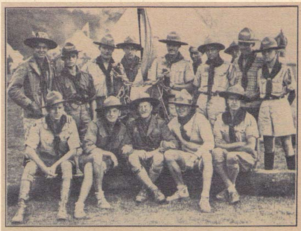
Jamboree 1929: Članovi Saveza skauta Kraljevine Jugoslavije na Trećem svjet- skom Jamboree- ju 1929. godine u Arrow Parku, Birkenhead u Velikoj Britaniji

Hrvatski izviđači-skauti članovi su svjetske skautske obitelji već gotovo čitavo stoljeće. U duhu skautske ideje da se svijet ostavi barem malo boljim nego što smo ga zatekli te pod motom "Budi pripravan" i na ovim je prostorima već stotinjak generacija djetinjstvo provelo učeći praktična životna iskustva na nekonvencionalan način - u društvu svojih vršnjaka uz žubor potoka i pucketanje logorske vatre.