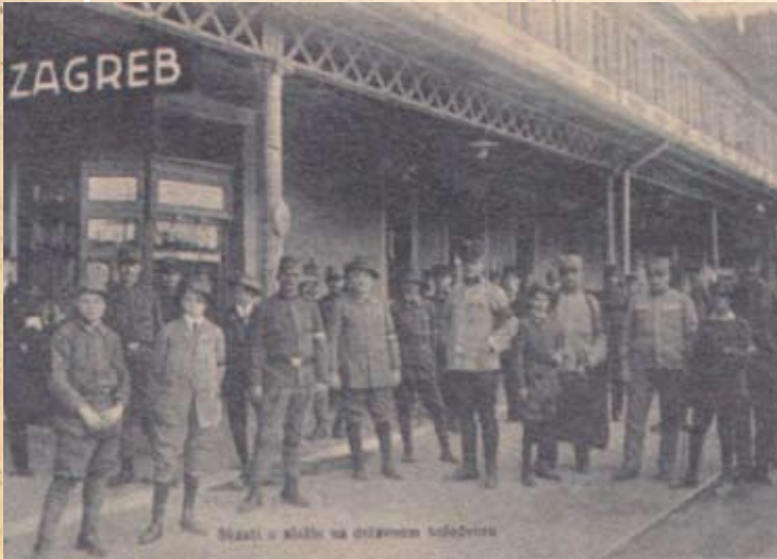
Iz Spomen-albuma hrvatskih skauta u Zagrebu 1914.-15.

gradskoj djeci pruži kvalitetnu i osmišljenu rasonodu kroz svladavanje vještina i znanja koje će ujedno utjecati na pozitivno oblikovanje njihovog karaktera. Želivši praktično provjeriti metode koje je promicao i ideje života vršnjačke skupine u prirodi, B.P. u kolovozu 1907. godine organizira prvo skautsko logorovanje s 22 dječaka iz svih britanskih staleža na Brownsea otoku. Ova je višednevna dječjačka avantura u prirodi označila službeni početak duge i bogate skautske povijesti. Knjižice naslovljene Scouting for boys , koje B.P. tijekom 1908. godine objavljuje u šest nastavaka, postale su najpopularnija mladeška literatura (uskoro prevedena na 35 jezika) koja je potakla mlade u Britaniji na samoinicijativno okupljanje u prve skautske patrole.