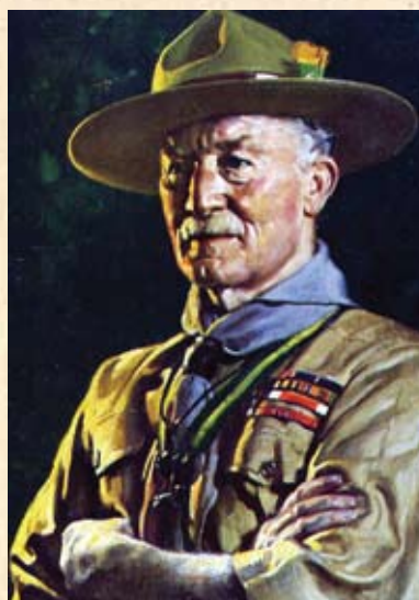
Robert Baden-Powell, utemeljitelj skautske organizacije, na prvoj međunarodnoj skautskoj smotri svijeta 1920. godine proglašen je Glavnim skautom svijeta (Chief Scout)

Na prostoru logora bilo je 673 šatora i četiri barake za upravu, prehranu, kantu i trgovinu skautske opreme. Skauti su dobivali sirove namirnice koje su sami morali kuhati u sklopu svojih jedinica. Logor je bio opskrbljen rasvjetom, vodom, telefonom, radiostanicama, sanitarnim čvorovima te šatorom za pružanje prve pomoći. Organizirana su natjecanja za prvenstvo Saveza u skautskim vještinama, lakoj atletici, plivanju, odbojci gađanju puškom te lukom i strijelom.